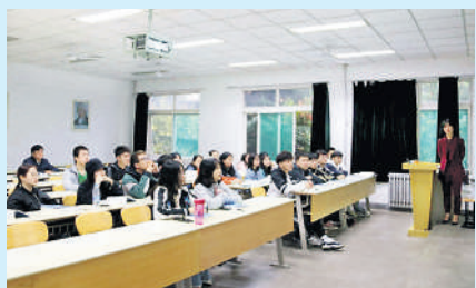
党委书记黄道峻听思政课

本报讯 上周,我校成功举办了“疫情防控与我国制度优势”主题教育周活动。马克思主义学院全体任课教师承担了为4000余名学生开展本次主题教育的授课任务,全体校领导认真观摩授课,校思想政治理论课建设领导小组成员、各二级学院院长、党委(党总支)书记等累计听课80余人次。