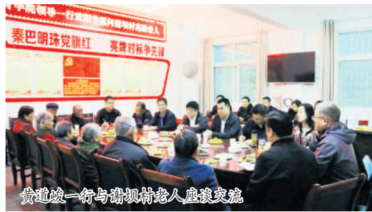
黄道峻一行与谢坝村老人座谈交流