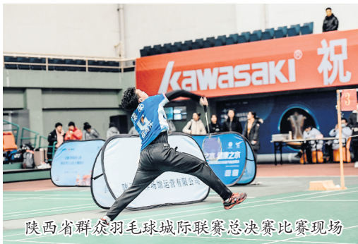
陕西省群众羽毛球城际联赛总决赛比赛现场

球、地掷球、中国式摔跤4个比赛类项目的决赛,同时承办群众赛事活动展演类包括广场舞、广播体操、健身气功、太极拳4个项目决赛的评审。