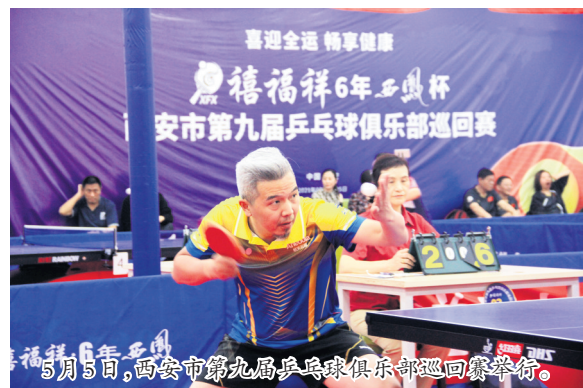
5月5日,西安市第九届乒乓球俱乐部巡回赛举行。

“全运会赛场上,专业选手们为成绩而拼搏,群众选手们也同样会获得自己的乐趣。”谈到上全运,一位正在参加西安市第九届乒乓球俱乐部巡回赛的业余选手表示,群众项目走进全运会赛场,平常百姓可以和奥运冠军、全国冠军,甚至自己的偶像共同成为赛场上的焦点,这是多么令人兴奋的一件事。而群众项目比赛也将按照全运会专业比赛的规格,做到同规则、同等级、同奖牌,老百姓从旁观者真正