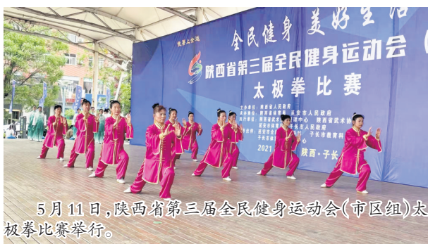
5月11日,陕西省第三届全民健身运动会(市区组)太极拳比赛举行。