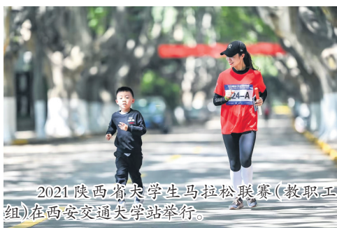
2021陕西省大学生马拉松联赛(教职工组)在西安交通大学站举行。

2008年,中国为全世界奉献了无与伦比的北京奥运会,而中国奥运军团获金牌51枚,名列金牌榜榜首,举国体制达到一个顶点。这个竞技高峰的顶点,在“体育大国”转向“体育强国”的全民思辨中,开始蜕变为中国迈向全民体育的拐点。而作为国家顶尖的综合性大赛全运会从第十二届起逐渐开启自我变革,首次提出了“全民全运”的口号,希望通过大赛让更多人投入全民健身的行列,增强普通百姓的参与度和获得感。